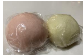
教育後援会より紅白饅頭をお祝いにいただきました。

「145年という伝統ある学校でしっかり学び、夢に向かって進んでほしい」という言葉が贈られ、子どもたちを応援する気持ちが伝えられました。